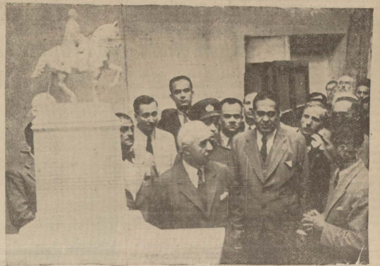
Millî Şef Akademiye Bürhan Topraktan izahat alıyorlar

İnönü San'at mektebi talebesine dediler ki: "Memleketin sizlere ihtiyacı büyüktür. Bunun için daha çok çalışmanızı ve iyi yetişmenizi istiyorum,"