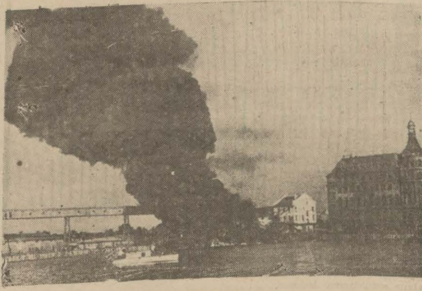
Sovyet şehirlerinden biri bombardımanlardan sonra yanarken

Ankara, 15 (Husus) — Meriçle Arda nehirleri üzerinde atılmış bulunan köprülerin tamiri ve Avrupa demiryoluunun bir an evvel açılması için evvelce cereyan etmekte olduğunu bildirdiğimiz müzakereler sona ermiş, anlaşma hasıl olmuştur. Bu hususta hazırlanmış olan mukavelelerin bugünlerde imzalanması beklenmektedir.